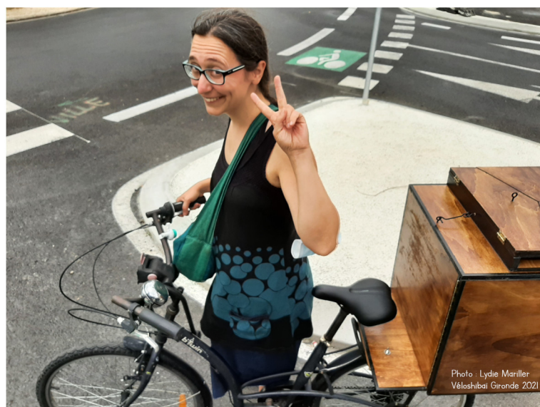
Vélomobilité Grande 2021